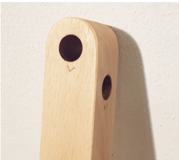
Fig. 2 Jambe de type X