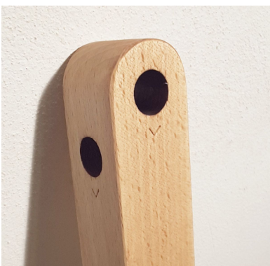
Fig. 3 Jambe de type Y