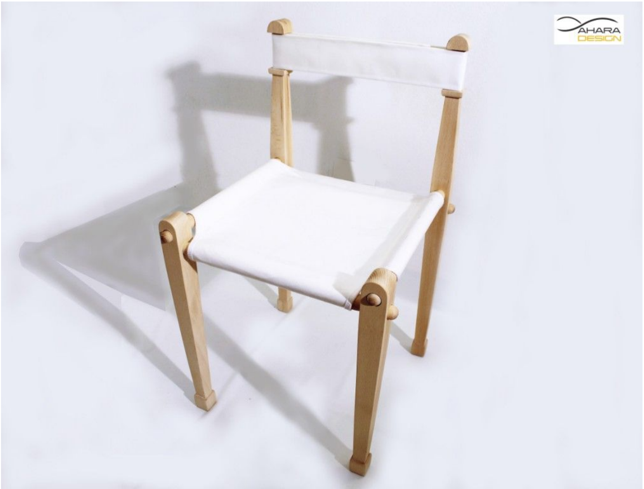
La sedia pronta.